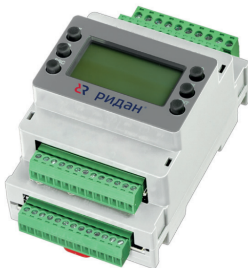
Рис. 1 Внешний вид контроллера

Контроллеры производительности типа Р-КП модификации 301 выполнены в одном корпусе со встроенным графическим дисплеем.