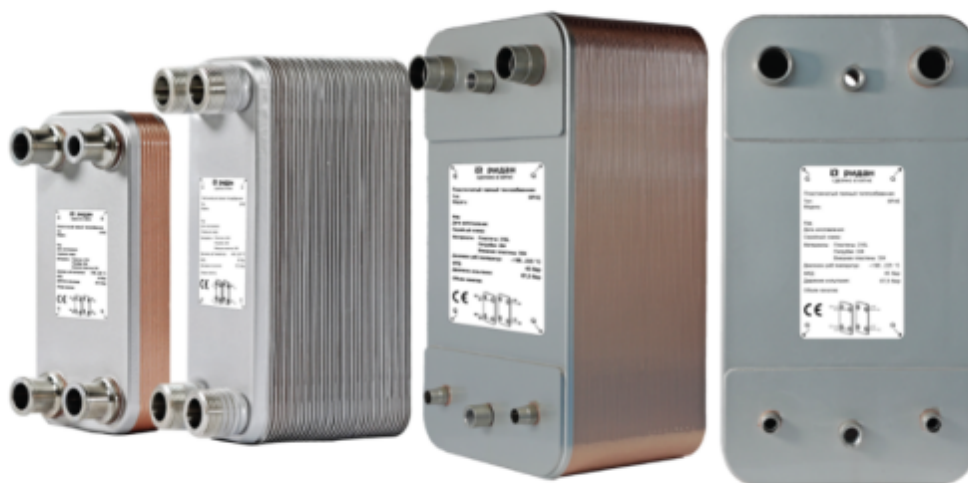
Рис.1 - Внешний вид теплообменников пластинчатых типа ВРНЕ

Теплообменники пластинчатые типа ВРНЕ предназначены для передачи тепловой энергии от одного теплоносителя к другому. Теплообменники пластинчатые типа ВРНЕ могут применяться в холодильных установках (компрессорных, абсорбционных), а также в тепловых насосах. В качестве рабочих сред могут использоваться негорючие хладагенты (фторуглероды, хлорфторуглероды, аммиак, CO 2 ), технические и холодильные масла, вода для технических нужд и систем ГВС, спиртосодержащие растворы.