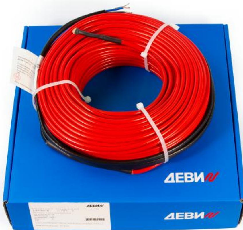
Рис. 1. Внешний вид нагревательного кабеля ДЕВИ Flex-18Т.